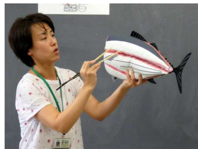
お魚の食べ方指導（魚の模型）

また、「秋刀魚の生姜煮」や「いわしの梅煮」の献立に合わせて、栄養教諭と担任で給食を食べるときに、魚の上手な食べ方について指導をする「おさかなデー」なども実施しています。