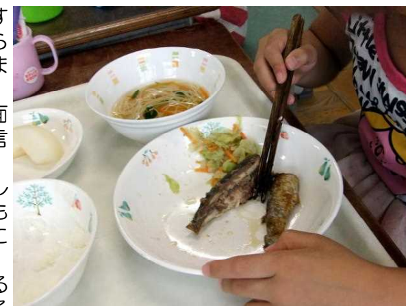
上手におはしでお魚を食べている子

学校で行う食育は、食について考えるきっかけであり、食育の基本はやはりそれぞれのご家庭での食生活が大変重要であることは言うまでもありません。ご家庭でも朝ごはんをしっかり食べる時間があるように早めに起こしたり、子供と一緒に食事を作ったり、食育の観点に目を向けた声かけや取り組みをお願いします。家族で食卓を囲み、配膳の向きや位置、箸の上げ下げやお茶碗の持ち方、食事のマナーを食卓で教えることも、子供たちの生き方につながっていく大切な躰です。一度乗ることができた自転車の乗り方を忘れなさいと言っても忘れられないように、一度付いた食習慣や健康に対する考え方は一生涯の宝物になると思います。だからこそ、チャンスを逃がさず子供のうちからしっかりと指導していきたいものです。